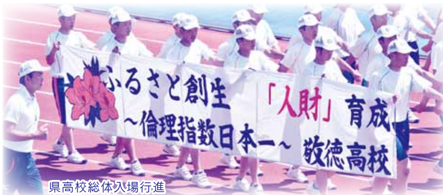
県高校総体入場行進